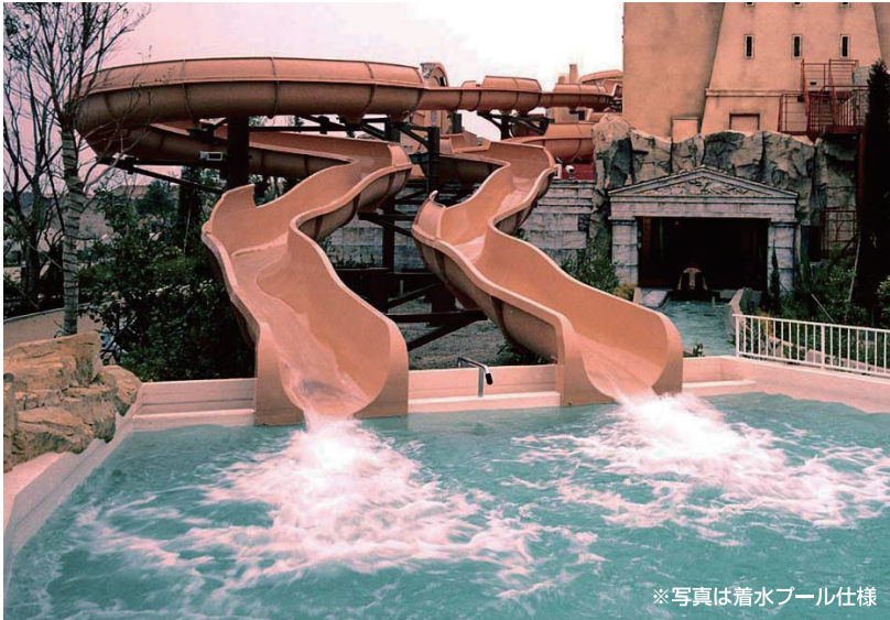
※写真は着水プール仕様