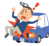
自動車にはねられてのケガ