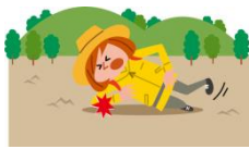
ハイキング中の事故によるケガ