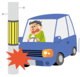
ドライブ中のケガ