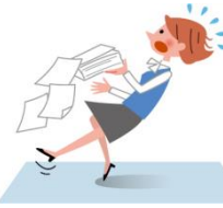
お仕事中、転んでのケガ