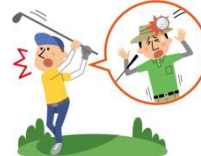
野球・ゴルフなどのボールが当たったケガ