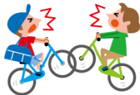
自転車との接触によるケガ